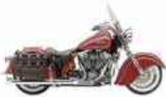
INDIAN CHIEF VINTAGE