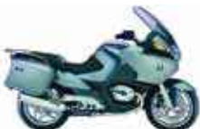
BMW R 1200 RT