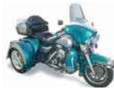
TRIKE - Harley