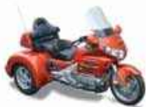
TRIKE - Honda