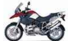
BMW R 1200 GS