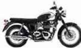
TRIUMPH BONNEVILLE T 100