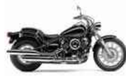
YAMAHA V-STAR 650