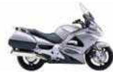
HONDA ST 1300