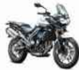
TRIUMPH TIGER 800